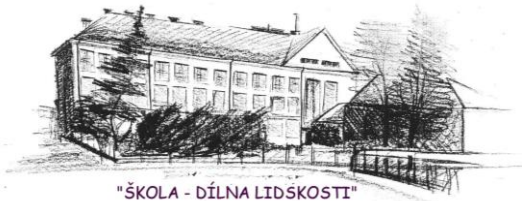
"ŠKOLA - DÍLNA LIDSKOSTI"

P - naplňuje ve školních podmínkách základní olympijské myšlenky – čestné soupeření, pomoc handicapovaným, respekt k opačnému pohlaví, ochranu přírody při sportu P - spolurozhoduje osvojované hry a soutěže