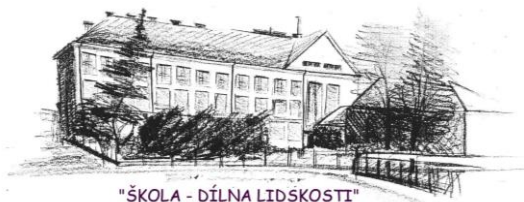
"ŠKOLA - DÍLNA LIDSKOSTI"